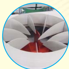
»» FT 502 HSF »» FT 502 VHSF