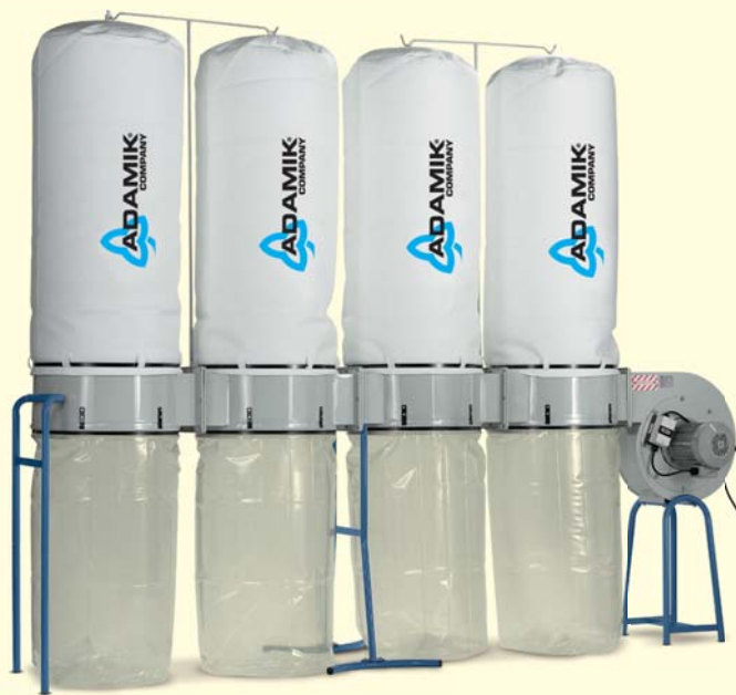
»» FT 404 SF »» FT 404 VSF