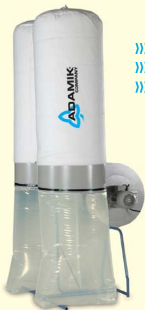
»» FT 402 SF »» FT 402 VSF »» FT 402 HSF