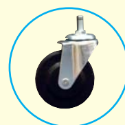
» FT 200 SF » FT 200 VSF