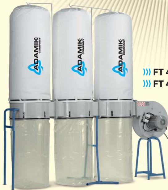
»» FT 403 SF »» FT 403 VSF