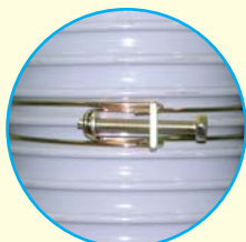
» FT 100 SF