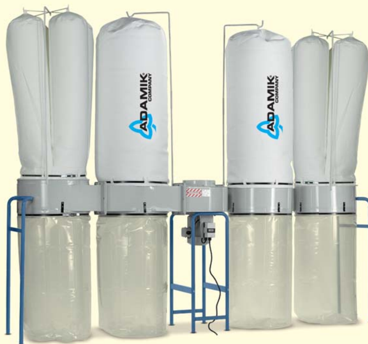
»» FT 504 HSF »» FT 504 VHSF