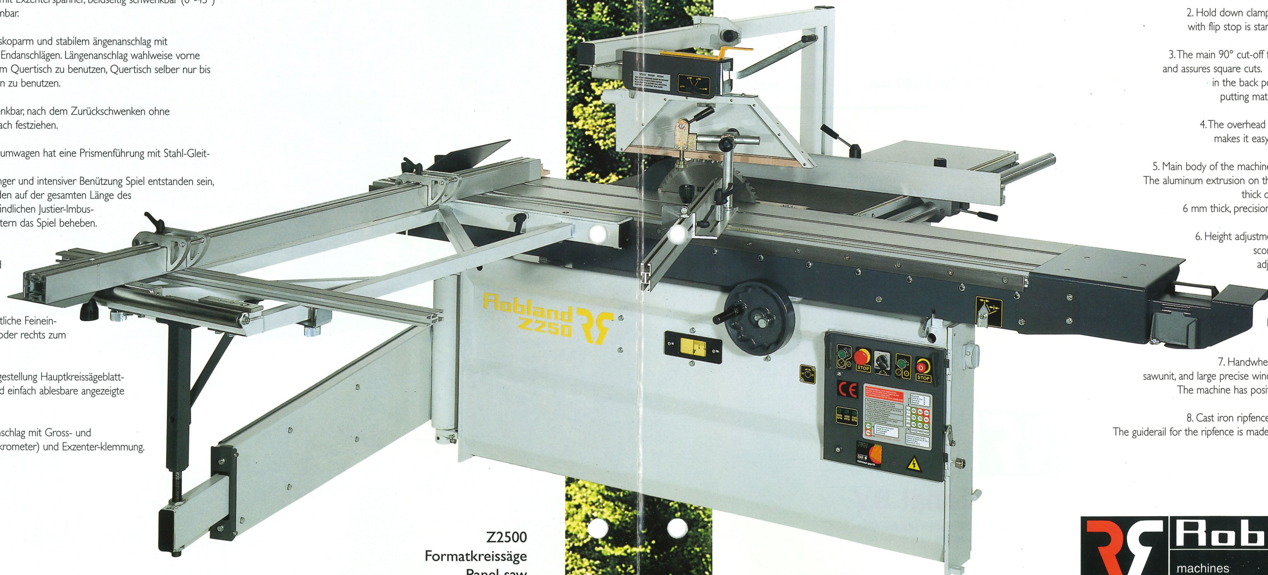
Z2500 Formatkreissäge Panel saw